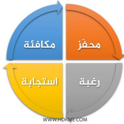
شكل يوضح كيف تبني العادات